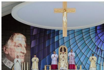
Papa Benedetto XVI durante la Messa per la beatificazione del cardinale John Henry Newman, Birmingham, 19 settembre 2010